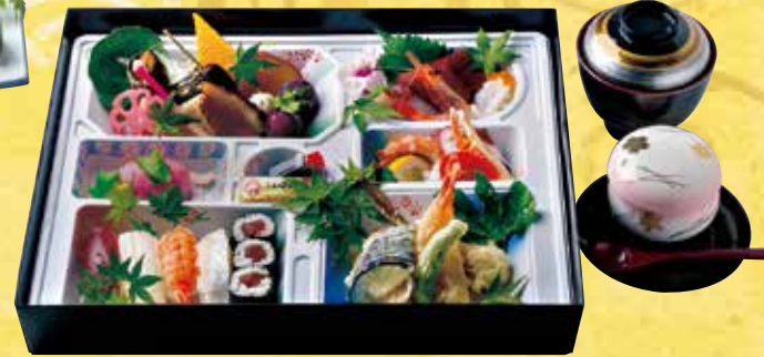
写真はバック容器

祝膳(にぎり寿司付きの場合) 5,000円 (税込) 祝膳のご注文は3日前までをお願いします。